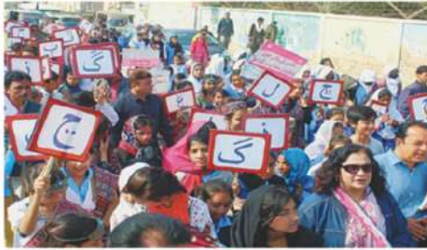
Participants in a public event by the Sindhi Language Authority as part of the campaign to get Sindhi declared as national language.

• Govt should give national status to languages of all provinces, speakers say • The drive would continue till Feb 28